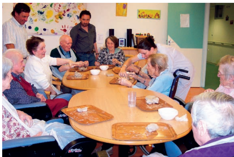
Les résidents Résidence La Pastellière SAÏX